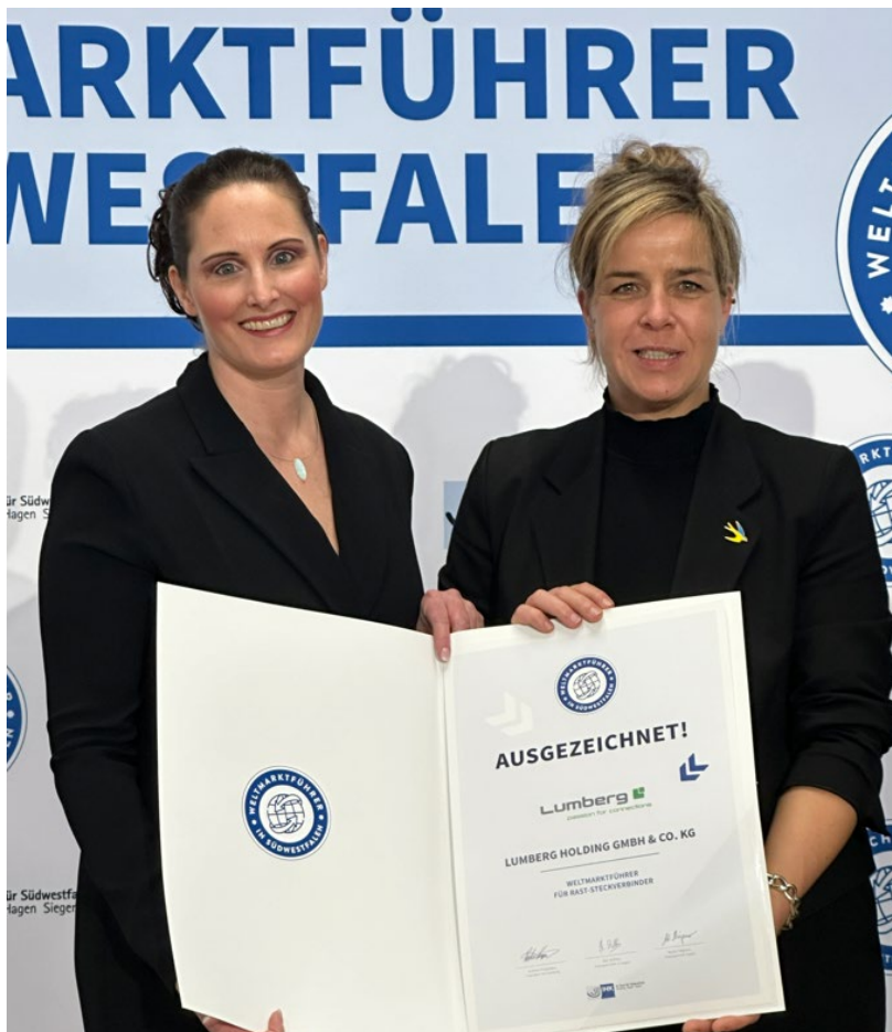
图 1: LUMBERG_Weltmarktführer 2024.jpg

左起：隆堡集团执行合伙人 Meike Schmidt ，北莱茵-威斯特伐利亚州经济、工业、气候保护和能源部长 Mona Neubaur